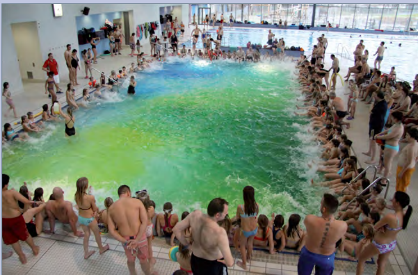
■ Wasserfärben bei der monatlichen Klatschnassparty