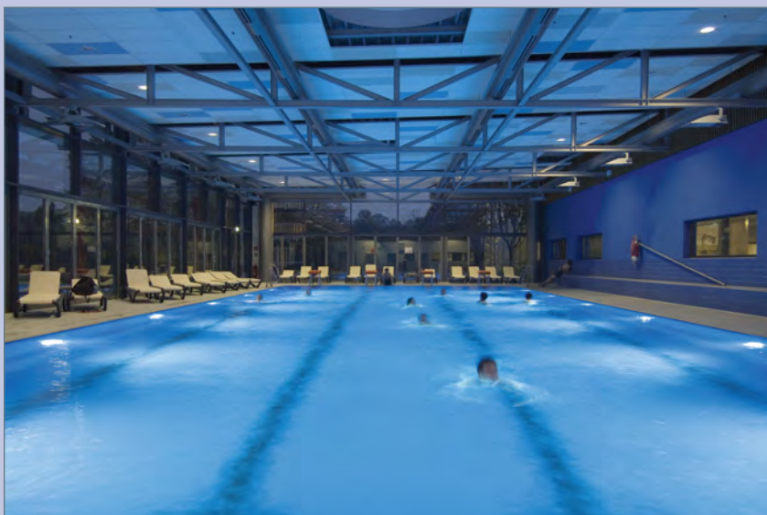
■ Sportbecken mit vier Bahnen à 25 m