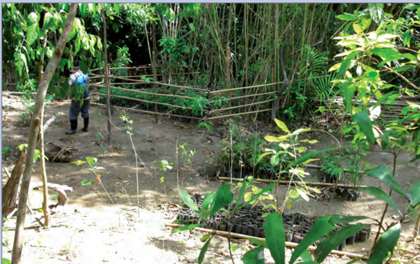
■ Tropenschutzprojekt auf den Philippinen; Foto: Freizeitbad LA OLA, Landau in der Pfalz