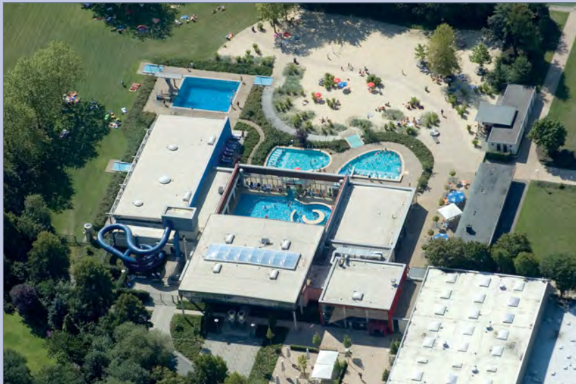
■ Luftbild mit geöffnetem Dach und geöffneten Fassaden; Foto: cabrio Senden – das Bad, Senden