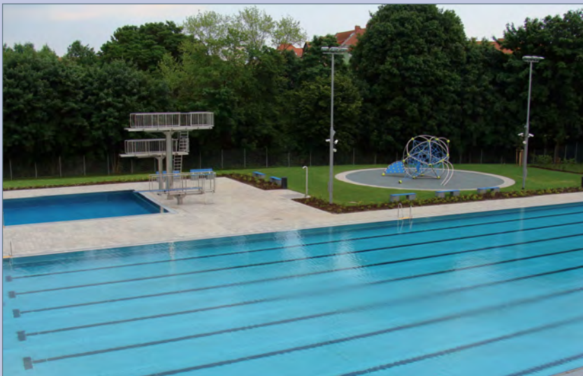
■ 50-m-Schwimmerbecken, Springerbecken und Klettergerüst; Foto: Architekturbüro Norbert Ruge, Ilmenau