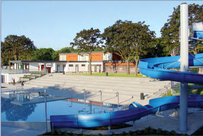
■ Funktionsgebäude und Nichtschwimmerbecken; Foto: Architekturbüro Norbert Ruge, Ilmenau