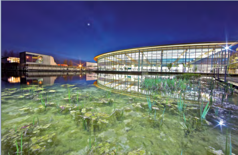
■ Der See, die Pfahlsauna und das Hallenbad