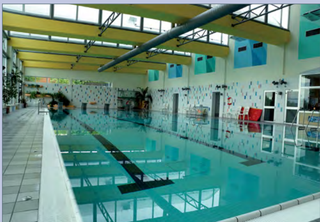
■ Die Schwimmhalle mit 4 x 25-m-Bahnen und einem Hubboden von 30 bis 180 cm Wassertiefe