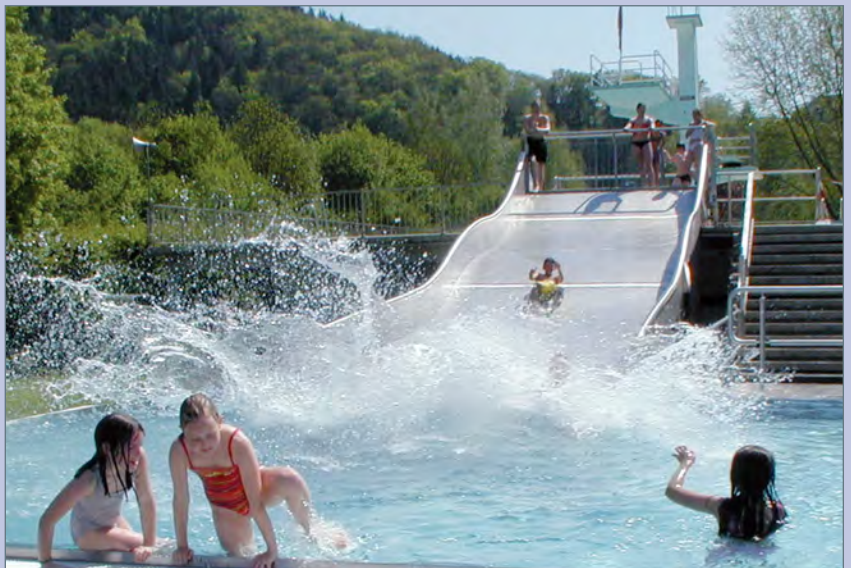
■ Breittrutsche vom Springer- zum Mehrzweckbecken