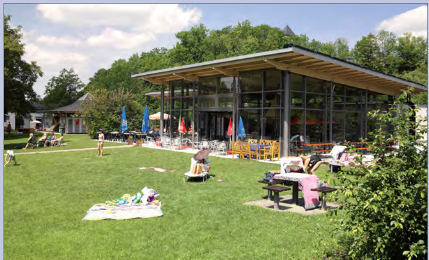
■ Cafeteria mit Sonnenterrasse und Cocktailbar