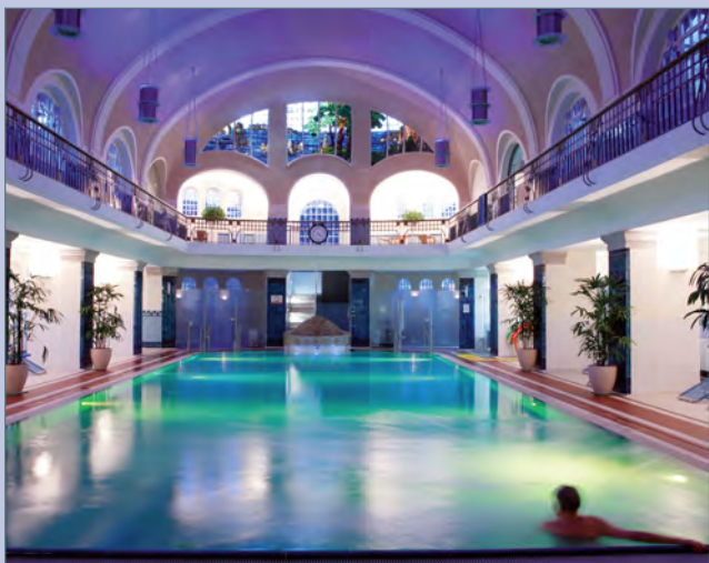
■ Jugendstilhalle bei Abendbeleuchtung; Foto: Stadtwerke Esslingen