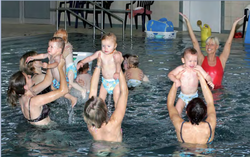
■ Babyschwimmen mit dem AquaAktiv-Team