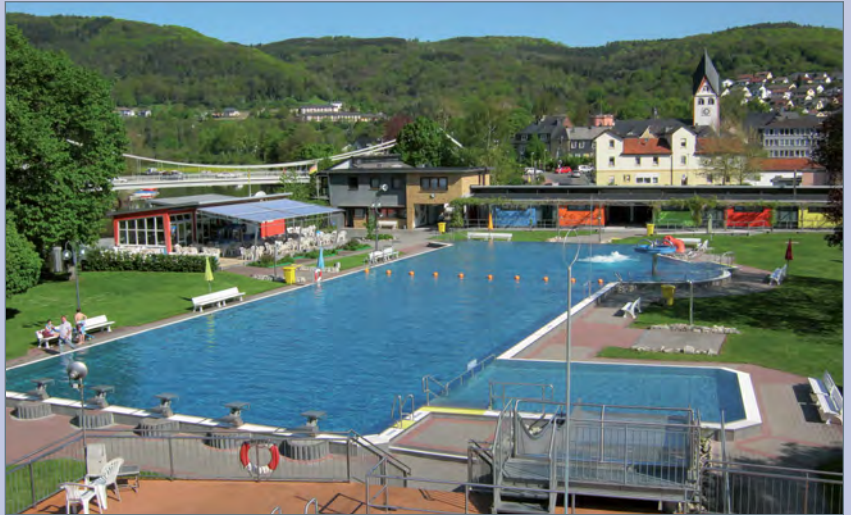
■ Blick vom Springerbecken auf das Mehrzweckbecken und die sanitären Anlagen (farbige Baukörper); Foto: Verbandsgemeinde Nassau