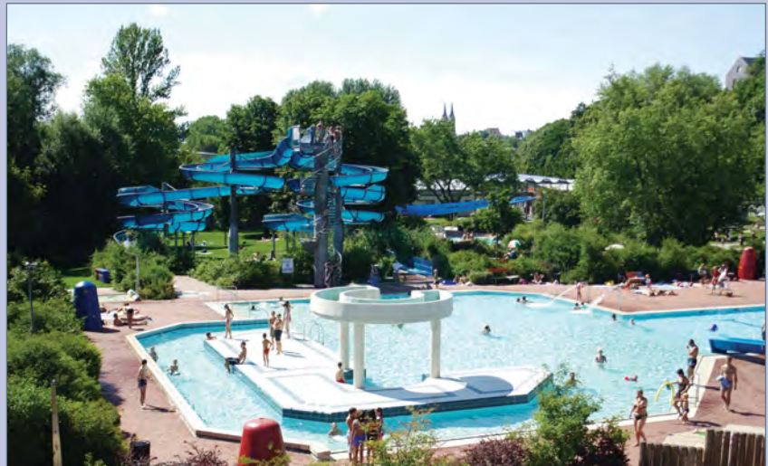
■ Spaßbecken mit Wasserfall und Strömungskanal, Blick auf die zwei 100-m-Rutschen